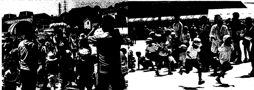
子ども会主催の運動会。保護者と子どもの距離が近いです。子ども、保護者、町内会の役員も一体となって競技を楽しみました。