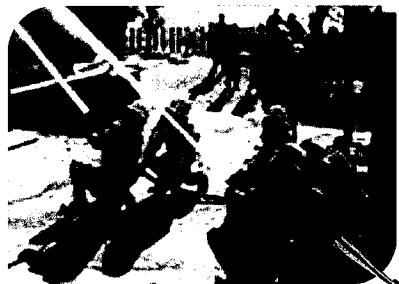
県重要文化財 草津八幡神社にて

1月16日(土)、西消防署及び古田分団、草津東町内有志、田方町内会及び有志の皆さんによって、文化財火災予防訓練が実施されました。火災通報の後、町内会、町内有志の皆さんで初期消火のバケツリレーを行いました。平均年齢少々高めですが寒い中、皆さん元気に参加しました。その後、西消防署と古田分団による放水消火活動がありました。今回は新しく出来た駐車場の活用でよりスムーズな流れでした。他人ごとと思わずに、お互いに日頃から防災に心掛けることを一段と感じさせられました。