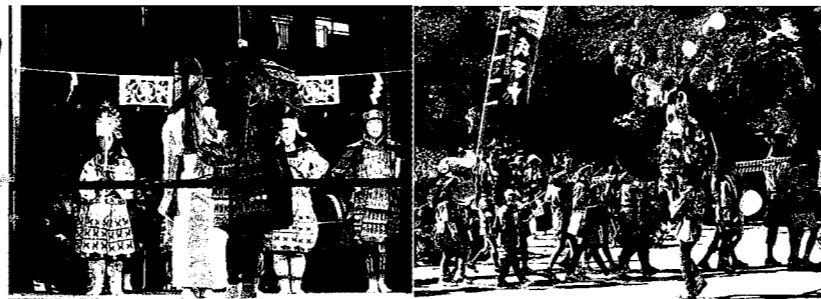
「秋季大祭」田方第一公園、神楽団の演舞、俵もみ古江新宮神社、神楽、花火の奉納、青年団や子ども達の俵もみ