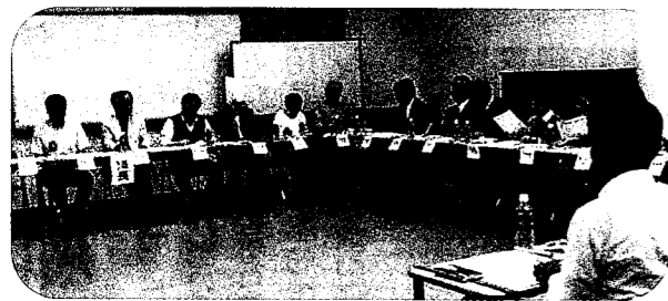
「古田学区社会福祉協議会総会」その年の予算、行事が決まります。1年のスタートです。