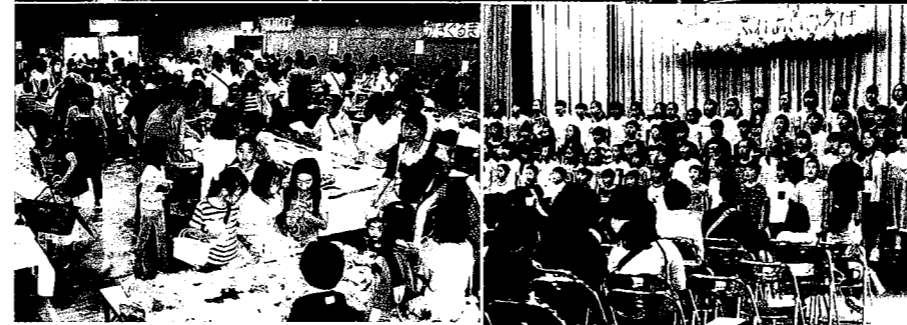
「ふれあいひろば」は、古田学区社協の最も大きな行事の一つです。当日は、小・中・高校生が歌・演劇・ジャグリングなどでステージを盛り上げてくれました。児童館では子どもたちが工作・ゲームを楽しみました。パサー会場は多くの人で賑わいました。