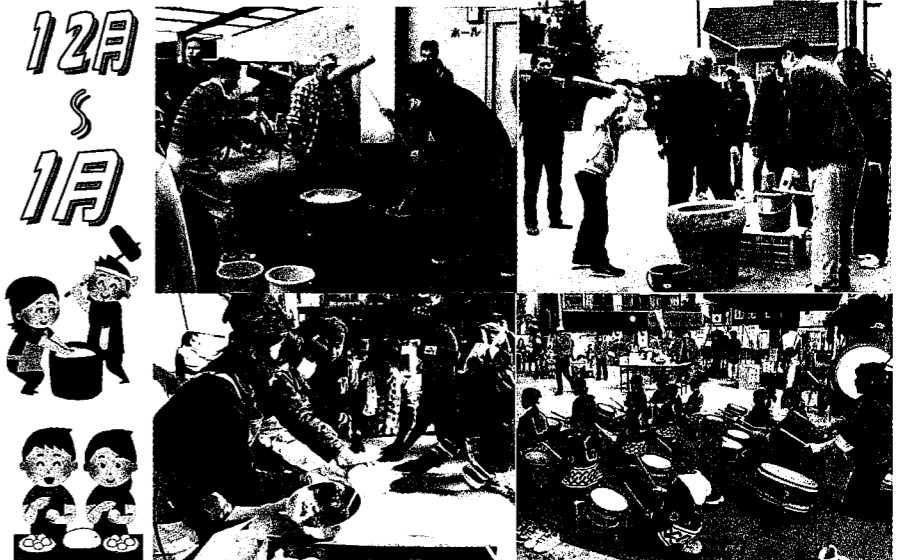
「とんど」無病息災を願う伝統的な行事です。「もちつき」古江西町、田方、古江東町、古江上、古江新町、それぞれ公民館、公園、境内を会場に昔ながらの臼や杵を使って子ども会・町内会が協力して行いました。