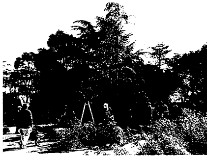
「とんど」を組み立てる 古江

古江新宮神社では、午後1時、年男が点火すると「とんど」は勢いよく燃え上がり、竹の弾ける大きな音に驚く人も。