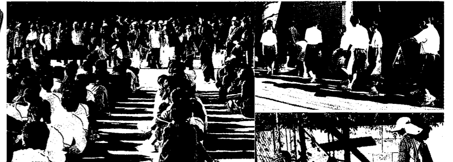
「地域一斉清掃」公衛協主催の行事です。小学生、中学生、保護者、地域の人がボランティアで参加し、古田小学校区の道路を清掃しました。